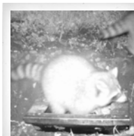
Waschbär ( Procyon lotor )