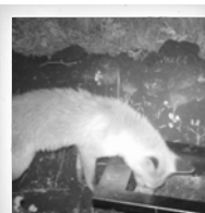
Fuchs ( Vulpes vulpes )