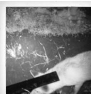
Fuchs ( Vulpes vulpes )