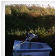
Nördlicher Raubwürger ( Lanius excubitor )

Die Fangwannen wurden am häufigsten von der Katze (2014), vom Waschbär (2017) und von der Elster (2018) geleert. 73% bzw. 68% der Feldmäuse wurden 2014 bzw. 2017 aus der Fangwanne entnommen. 2018 wurden 46% der Feldmäuse entnommen. Die Standby-Box wurden am häufigsten von der Katze (2014; 2018) und vom Waschbär (2017) geleert. Insgesamt