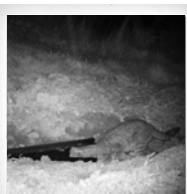
Hauskatze ( Felis silvestris catus )