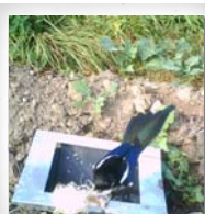
Elster ( Pica pica )