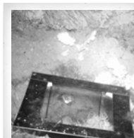
Wanderratte ( Rattus norvegicus )