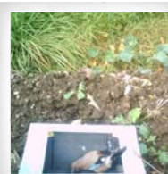
Eichelhäher ( Garrulus glandarius )