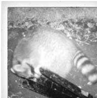
Waschbär ( Procyon lotor )

wurden 12% (2014), 28% (2017) und 4% (2018) der Feldmäuse aus der Standby-Box entnommen. Eine Landnutzungsanalyse der Umgebung (2 km Radius) ergab, dass Prädatoren seltener an den Versuchsflächen vorbeikommen, wenn der Anteil an bebauter Fläche über 25% ist. Raubvögel kommen häufiger vor, wenn die Landschaft durch Gebiete mit natürlicher Vegetation geprägt ist. Um zu gewährleisten, dass i.d.R. alle Feldmäuse entnommen werden, müssen jedoch weitere Versuche durchgeführt werden.