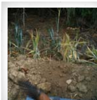
Turmfalke ( Falco tinnunculus )