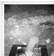
Steinmarder ( Martes foina )