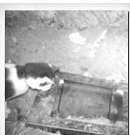
Hauskatze ( Felis silvestris catus )