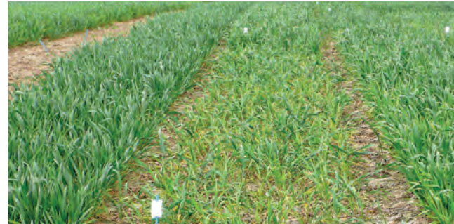
Lückiger Bestand in einer anfälligen Weizensorte durch SBWMV-Infektion