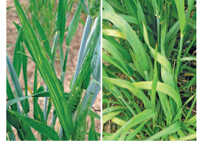
Strichel- und Mosaiksymptome an infizierten Blättern, die später absterben können

Im Verlauf der Vegetation breitet sich die Virusinfektion über die nachfolgenden Blattstadien bis ins Fahnenblatt aus.