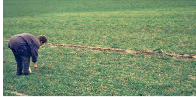
Vergilbte Triticale-Pflanzen in einem Infektionsherd mit WSSMV nach der Überwinterung im Februar

Nach der Aussaat des Wintergetreides keimen aus den Dauersporen von Polymyxa Zoosporen aus, die aktiv in die Wurzeln der Sämlinge eindringen. Sind die Zoosporen mit Viren beladen, werden diese in den Wurzeln freigesetzt und können die ganze Pflanze infizieren. So entstehen nach der Überwinterung in den Feldern auffällige Areale mit vergilbten Pflanzen.