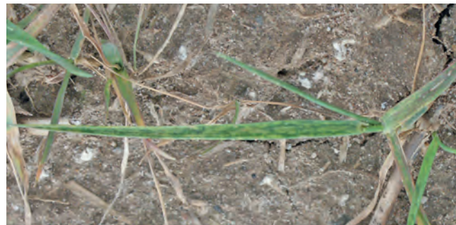
Mosaiksymptome des SBWMV in Winterweizen nach der Überwinterung im März

Bei starkem Virusbefall sind Pflanzen in ihrer Entwicklung beachtlich gehemmt. Die Symptome - grüne oder gelbe Mosaik - sind mit Beginn des Pflanzenwachstums im Frühjahr in den neu nachwachsenden Blättern erkennbar.