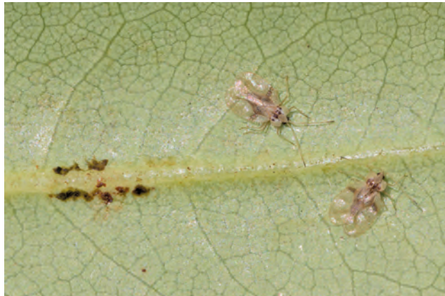
Eiablagestellen von Stephanitis rhododendri

Netzwanzen sind eher träge und relativ ortstreu. Die transparenten Eier werden in der Nähe der Hauptblattadern vor allem an jungen Blättern abgelegt. Dabei werden sie von der Blattunterseite in das Blatt geschoben und mit einem pechschwarzen Kottropfen abgedeckt. Die Eier überwintern im Blatt. Die im Frühjahr (etwa ab Mai) erscheinenden Larven sind 1 - 2 mm groß und flugunfähig. Sie durchlaufen bis zur adulten Wanze vier Häutungen. Die zunächst