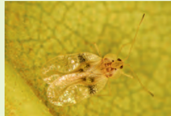
Amerikanische Rhododendron-Netzwanze ( Stephanitis rhododendri )