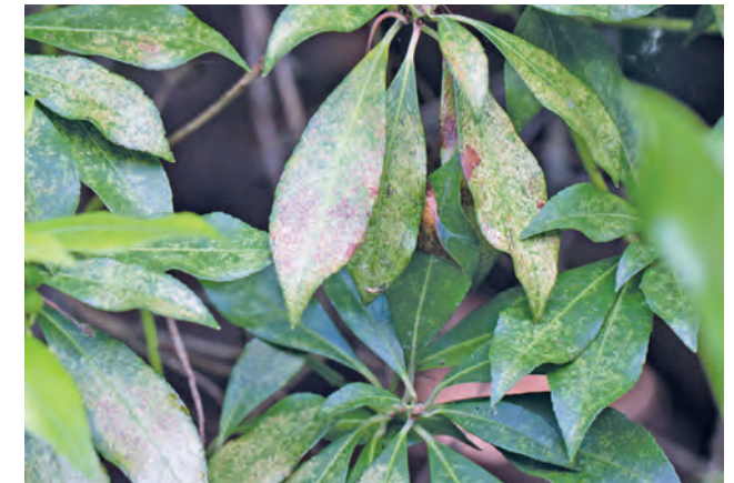
Schaden an Lavendelheide durch Andromeda-Netzwanze

Durch die Saugschäden der Larven treten ab Mai helle Sprengel auf der Blattoberseite auf. Diese konzentrieren sich zunächst in der Nähe der Blattrippen. Im Laufe des Sommers und mit zunehmendem Befall ist das gesamte Blatt mit Ausnahme der Hauptadern von den Aufhellungen betroffen. Es folgen eine großflächige Verfärbung, Einrollen und schließlich Vertrocknen der Blätter. Dies kann ein Verkahlen der Pflanze zur Folge haben. Tritt die Andromeda-Netzwanze massenhaft auf, kann es an Lavendelheide zu massiven Schäden bis zum Absterben der Pflanze kommen (siehe Bild Titelspalte). Auf der Blattunterseite findet man dunkle Kottropfchen und ggf. abgestreifte Larvenhäute.