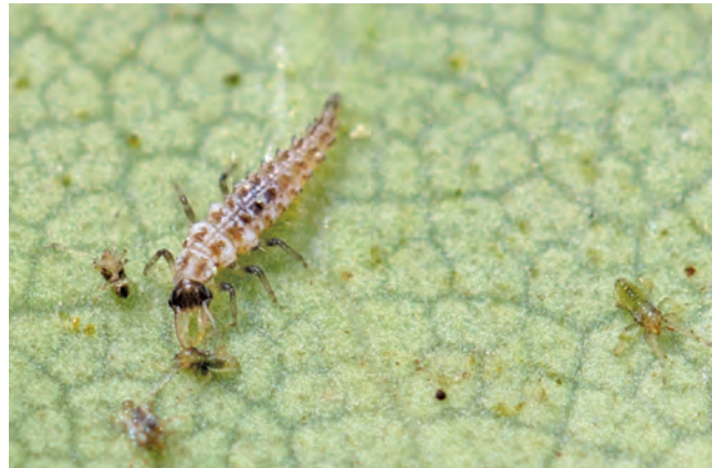
Florfliegenlarve frisst junge Netzwanzenlarven

Brand, T., 2014: Netzwanzen an Rhododendron. Rhododendron und Immergrüne , Band 16, 69-74.