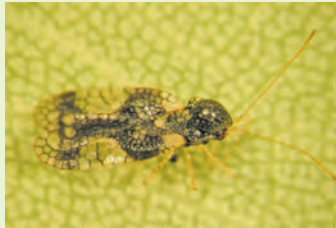
Andromeda-Netzwanze ( Stephanitis takeyai )

Als Schadinsekten treten bei uns vor allem an Rhododendron und Lavendelheide die Andromeda-Netzwanze ( Stephanitis takeyai ), die Amerikanische Rhododendron-Netzwanze ( Stephanitis rhododendri ) und - von geringerer Bedeutung - die Europäische Rhododendron-Netzwanze ( Stephanitis oberti ) auf. Die genannten Wanzen sind in der Regel 3,5 - 4 mm groß. Die transparenten Flügeldecken der ausgewachsenen Tiere weisen eine charakteristische netzartige Struktur auf. Die Flügel sind deutlich länger als der Körper.