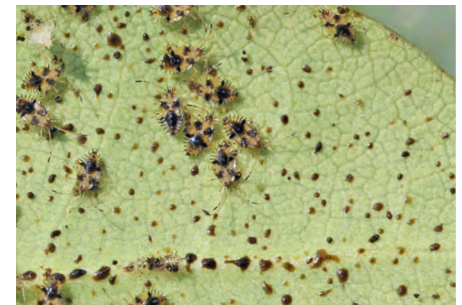
Larven und Kottropfen auf Blattunterseite