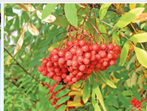
Die Edelebereschensorte 'Konzentra' aus Pillnitzer Züchtung Rowan cultivar 'Konzentra' from the Pillnitz breeding program

The core competence of the Institute for Breeding Research on Fruit Crops in Dresden is focused on