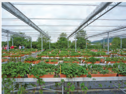
Erhaltung von Erdbeersorten und Fragaria -Wildarten in der Obstgenbank Maintenance of strawberry cultivars and Fragaria wild species in the Fruit Gene Bank

Eine erfolgreiche Obstzüchtung wird in Zukunft vom Einsatz molekularbiologischer und biotechnologischer Züchtungsmethoden abhängig sein. Vor allem die marker-gestützte Selektion (MAS) hat sich zu einem unverzichtbaren Verfahren entwickelt. Bei der Auswahl der Eltern, die für eine Kreuzung verwendet werden, kommen nicht nur äußere Merkmale (Phänotyp) in Betracht.