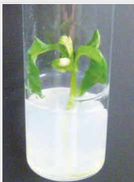
Embryo rescue bei Süßkirsche Embryo rescue in sweet cherry

Im Institut für Züchtungsforschung an Obst wird Zuchtmaterial bis zur neuen Sorte entwickelt. Die Eignung von Sortenkandidaten für den Anbau in Deutschland wird durch den Versuchsanbau der Zuchtklone in den Landesanstalten getestet. Diese wertvolle Zusammenarbeit ermöglicht es, aussichtsreiche Kandidaten auszuwählen, die dann nach einem Prüfverfahren beim Bundessortenamt oder dem europäischen Sortenamt sortenrechtlich geschützt werden. Sie stehen dann dem deutschen Obstbau als neue Sorten zur Verfügung. Sortenschutzinhaber ist das JKI. Die Verwertung der Pillnitzer Obstsorten erfolgt über ein international tätiges Lizenzbüro, die Deutsche Saatgutgesellschaft mbH Berlin ( www.dsg-berlin.de ).