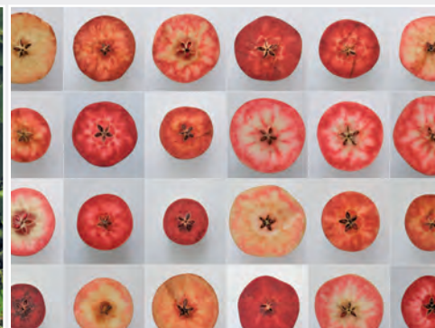
Nachkommenschaft einer Kreuzung mit einer rotfleischigen Apfel-Wildart Progeny after crossing with a red-fleshed wild apple species

The cultivars and accessions of wild species are maintained in ex situ field collections in order to preserve the integrity of the material. At the same time the benefits of these active collections can be described as follows: The perennial plant material can be evaluated comprehensively as well as utilized immediately as primary material for breeding purposes and for plant material exchange. The Malus (apple) collection as well as the Fragaria (strawberry) collection represent the largest ones in Europe.