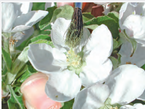
Kreuzungen bei Apfel: Künstliches Bestäuben der Narben mit fremden Pollen Apple crossing: artificial pollination with foreign pollen

Die Charakterisierung der Wirkungsweise von Genen - vor allem von Resistenzgenen aus dem Wildarten-Genpool - und ihrer Beteiligung an der Merkmalsausprägung im Phänotyp werden mit Hilfe gentechnischer Verfahren durchgeführt (funktionelle Genomanalyse). So richten sich die Institutarbeiten beim Apfel vor allem auf die Verbesserung der Feuerbrandresistenz. Mit der kürzlich entwickelten Fast-breeding-Technologie, der gentechnisch veränderte Apfelpflanzen mit einer stark verkürzten juvenilen Phase zugrunde liegen, ist es möglich, innerhalb von wenigen Jahren mehrere Kreuzungsgenerationen bei Gehölzpflanzen zu absolvieren. Der Fast-Breeding-Ansatz gewinnt seine Bedeutung und Eleganz vor allem aus der Tatsache, dass in den späten Selektionsstufen zielgerichtet Zuchtklone ausgelesen werden können. Diese enthalten die gewünschten Resistenzgene, sind aber nicht transgen, da sich das zuvor eingebaute Gen für „frühe Blüte“ entsprechend den Mendelschen Regeln herauspalтет.