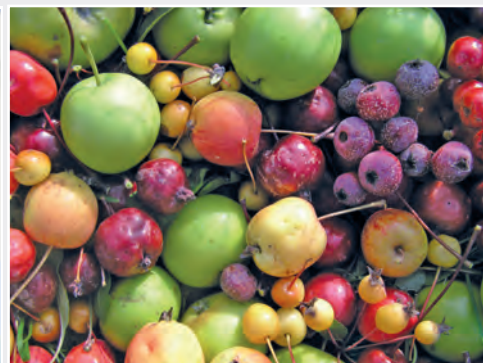
Wildäpfel – die Vorfahren des Kulturapfels Wild apples – ancestors of domesticated apple

tial technology. Not only visible traits (phenotype) of the plants are under investigation when selecting parent generation for crosses. The genetic background (genotype) is analyzed as well in order to select appropriate parents. Based on this, suitable parents are used for hybridization aimed on a targeted combination of traits in the progenies. Later on molecular markers will be applied to select progenies based on their genome in an early stage of the breeding process. This is especially the case when desired traits still are not expressed, i.e. only later during flowering and fruiting of the tree. Due to this very early possibility of selection, breeding programs can be realized more efficiently concerning personal and spatial resources and in a shorter time frame.