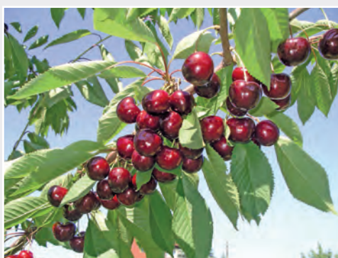
Neue Süßkirschsorte 'PiSue 161' New sweet cherry cultivar 'PiSue 161'