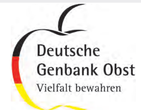
Logo der Deutschen Genbank Obst (DGO) Logo German National Fruit Gene Bank