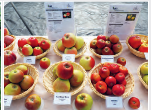
Präsentation der Apfelsortenvielfalt am „Apfeltag“ Presentation of apple diversity