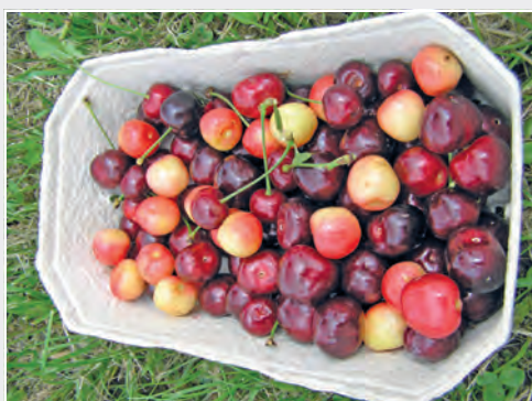
Diversität bei Süßkirsche Diversity of sweet cherry

In der Bundesanstalt für Züchtungsforschung an Kulturpflanzen (BAZ) wurde die Obstzüchtung ab 1992 in Dresden fortgesetzt. Mit der Reorganisation der Forschung des früheren Bundesministeriums für Ernährung, Landwirtschaft und Verbraucherschutz wurde zum 1. Januar 2008 das Julius Kühn-Institut (JKI) gegründet und die Pillnitzer Obstzüchtung als wichtiges Arbeitsgebiet integriert. Eine enge partnerschaftliche Zusammenarbeit verbindet die