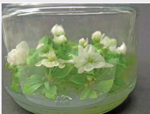
Induktion der Blütenbildung an In-vitro -Pflanzen bei Apfel Induction of flowering on in vitro apple plants

Kommerziell angebaut werden in Deutschland gegenwärtig ca. 30 verschiedene Obstarten mit nur jeweils wenigen Sorten. Daher sammelt, erhält, charakterisiert und dokumentiert das Institut die noch vorhandene Vielfalt von Obstarten und -sorten sowie verwandter wild vorkommender botanischer Arten und Gattungen. Besonderes Interesse gilt alten Sorten mit soziokulturellem, lokalem oder historischem Bezug zu Deutschland. Bewertet werden vor allem pomologische und phänologische Merkmale sowie die genetische Diversität. Diese Daten schaffen die Grundlage, das Material u. a. für züchterische, obstbauliche und landschaftsgestaltende Aufgaben zu nutzen. Nur Material, dessen Eigenschaften bekannt sind, kann durch die Züchtung gezielt in Wert gesetzt werden. Darum bündeln sich die Arbeitsinhalte des Instituts zur Erhaltung genetischer Ressourcen, Phytopathologie, Züchtungsforschung und Züchtung in diesem Punkt. Alle erhobenen Daten werden zukünftig in einer gemeinsamen Datenbank für Evaluierungs- und Charakterisierungsdaten erfasst.