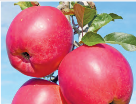
Neue Apfelsorte 'Joachim Gauck' New apple cultivar 'Joachim Gauck'