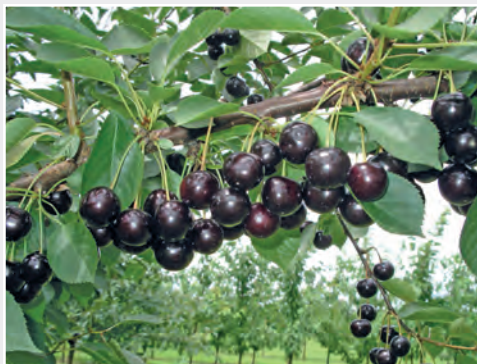
Neue Sauerkirschsorte 'Taurus' New sour cherry cultivar 'Taurus'