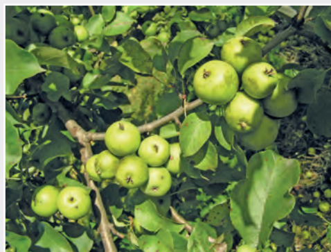
Der heimische Holzapfel Malus sylvestris Indigenous apple species Malus sylvestris