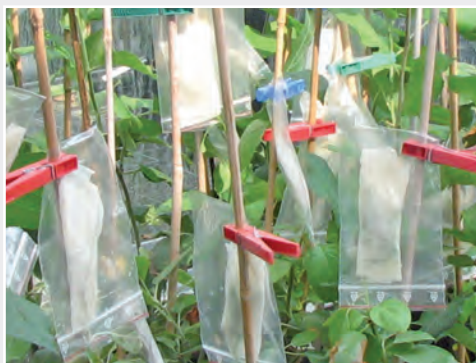
Resistenzprüfung von Apfelsämlingen durch künstliche Inokulation von Schorfpilzen Testing for resistance: inoculation of apple scab on apple seedlings