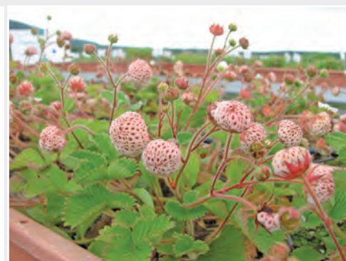
Die Erdbeerwildart Fragaria nilgerrensis Wild strawberry species Fragaria nilgerrensis

are in the responsibility of the Saxon State as well as of the Federation, located at Dresden-Pillnitz. They preserve the tradition of horticulture in the framework "The Green Forum Pillnitz".