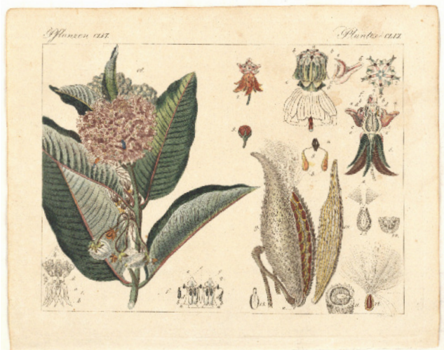
MERKWÜRDIGE PFLANZEN. DIE SEIDENPFLANZE, UM 1810, KUPFERSTICH/WASSERFARBEN, 19,3 X 24,2 CM

ZUR AUSSTELLUNG: Das Julius Kühn-Institut wurde 2008 durch die Zusammenführung früherer Einrichtungen als Bundesforschungsinstitut neu gegründet. Hauptsitz ist Quedlinburg mit Schwerpunkten zur Züchtung gartenbaulicher Kulturen, der Ökologischen Chemie und anderen Forschungsbereichen. Dieser überregionale Wissenschaftsstandort wird nicht auf Anhieb mit Quedlinburg in Verbindung gebracht. Bekannter ist die Stadt für ihren Status als UNESCO-Weltkulturerbe mit dem weltweit größten Flächendenkmal für Fachwerkbauten. Die Lyonel-Feininger-Galerie, gegründet 1986, passt ebenso wenig in dieses Bild. Sie betreut mit der Sammlung Dr. Hermann Klumpp eine der bedeutendsten Sammlungen von Werken Lyonel Feiningers. Seit 2014 wird die Galerie zu einem „Museum für grafische Künste“ ausgebaut.