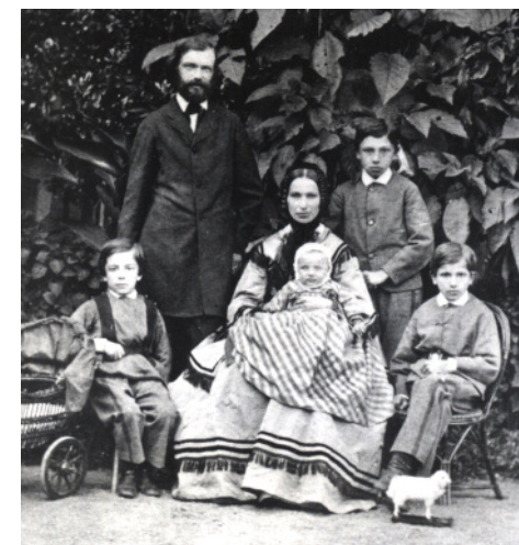
JULIUS KÜHN MIT FAMILIE, CA. 1871

JULIUS KÜHN gilt als Begründer der modernen Phytopathologie (die Lehre von den Pflanzenkrankheiten) und gehört zu den wegweisenden Reformern der Landwirtschaftslehre im 19. Jahrhundert. Nach Kühns Plänen entsteht 1863 mit dem landwirtschaftlichen Universitätsinstitut in Halle/Saale die bedeutendste Lehr- und Forschungseinrichtung Deutschlands. Neben akribischen Versuchsreihen und mikroskopischen Studien räumt er der praktischen Forschung einen besonderen Stellenwert ein. Hierher gehört auch die Einrichtung von Dauerfeldversuchen („Ewiger Roggenbau“), Demonstrationsgärten, Laboratorien und Lehrmittelsammlungen. Seine rege Publikationstätigkeit wird im „Kühn-Archiv“, die von ihm begründete Forschung wird im Julius Kühn-Institut fortgeführt.