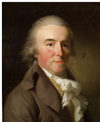
PORTRÄT FRIEDRICH JUSTIN BERTUCH, GEMALT VON JOHANN FRIEDRICH AUGUST TISCHBEIN, 1796, GLEIMHAUS HALBERSTADT – MUSEUM DER DEUTSCHEN AUFKLÄRUNG

FRIEDRICH JUSTIN BERTUCH gehört zum verbreiteten Typus des universell dilettierenden Aufklärers im ausgehenden 18. Jahrhundert. Er arbeitet als Übersetzer, Herausgeber, Schriftsteller, Beamter, Pädagoge, Verleger und Unternehmer. Sein Hauptwerk ist das „Bilderbuch für Kinder, enthaltend eine angenehme Sammlung von Thieren, Pflanzen, Blumen, Früchten, Trachten und allerhand anderen unterrichtenden Gegenständen aus dem Reiche der Natur, der Künste und Wissenschaften; alle nach den besten Originalen gewählt, gestochen und mit einer kurzen wissenschaftlichen und den Verstandeskräften eines Kindes angemessenen Erklärung“. Die Sammlung umfasst 12 Bände, die in 237 Lieferungen zwischen 1790 und 1830 in einer Auflage von 3.000 Exemplaren erschienen und 1.185 kolorierte Kupferstiche vereinen.