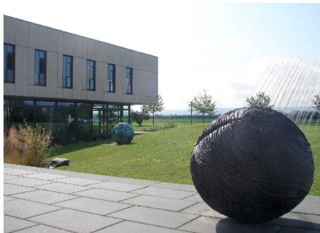
HAUPTGEBÄUDE JULIUS KÜHN-INSTITUT

2008 wird das JKI gegründet durch Zusammenführung der Biologischen Bundesanstalt für Land- und Forstwirtschaft, der Bundesanstalt für Züchtungsforschung an Kulturpflanzen und Teilen der Bundesforschungsanstalt für Landwirtschaft.